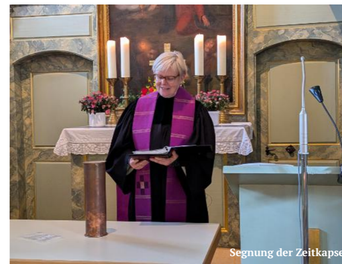
Segnung der Zeitkapsel