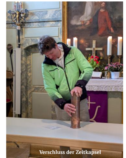
Verschluss der Zeitkapsel