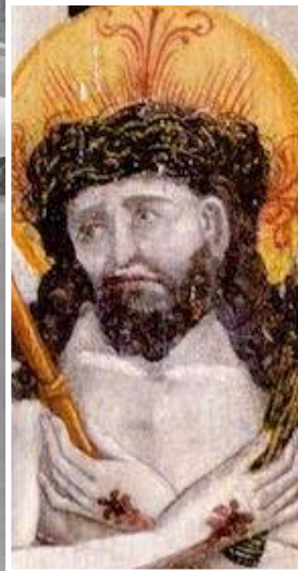
Tafelbild 15. Jhdt.