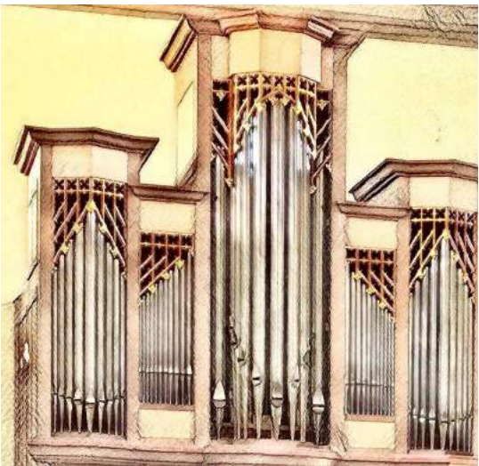
Orgel: ursprünglich von G. F. Steinmeyer 1877 erbaut, mehrfach umgebaut und neu disponiert