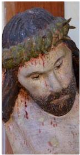
Kruzifix (15. Jhdt.?)