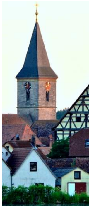
Turmhöhe: 44,5 m