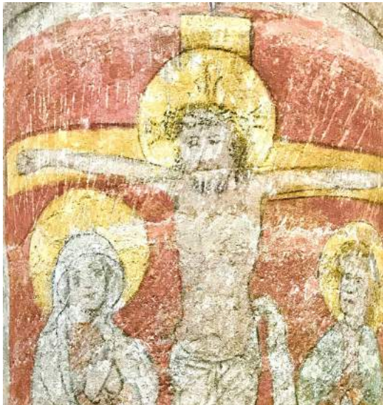
Wandmalereien an den östlichen Langhauspfeilern aus der Erbauungszeit der Kirche. Nordseite: Kreuzigung mit Maria und Johannes. Südseite: »Gnadenstuhl«? (schadhaft)