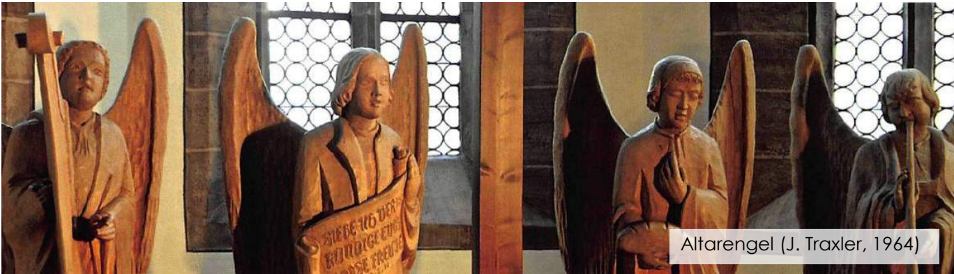
Altarenge (J. Traxler, 1964)